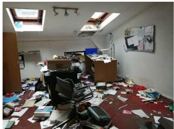
Administrativní budova - kancelář v podkroví