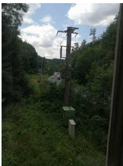
Sloupová trafostanice na pozemku č.parc. 723/3 a vedení vysokého napětí nad pozemky č.parc. 723/2 a 723/1