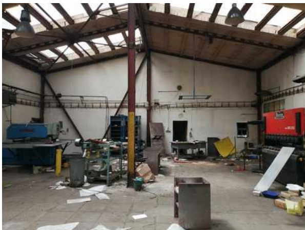
Větší výrobní hala se sedlovou střechou