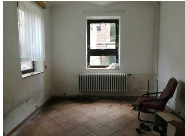
Administrativní budova - kanceláře v přízemí