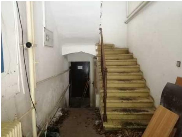
Administrativní budova - schodiště do patra