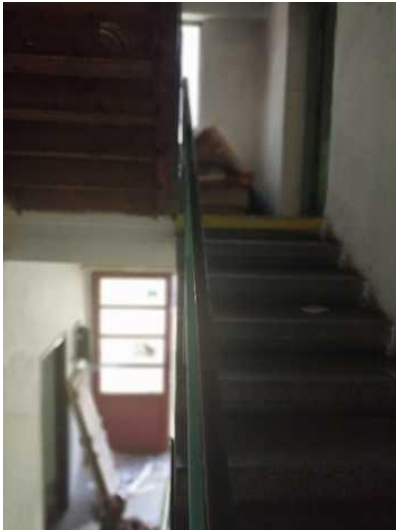
Budova skladu - montážní dílna schodiště do patra