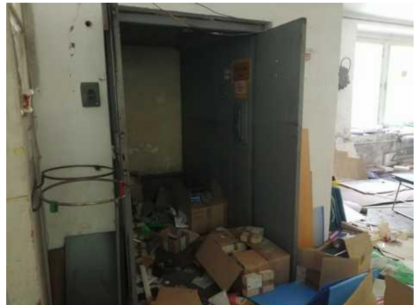
Budova skladu - nákladní výtah se třemi zastávkami - přízemí, nádvoří rampa a patro