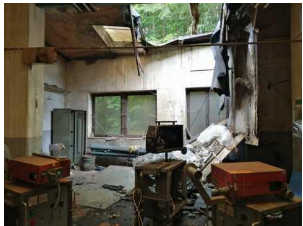
Poškozená střešní krytina ve výrobní hale