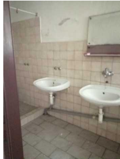
Budova skladu - šatny v přízemí