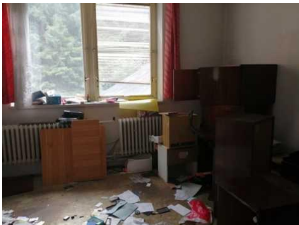
Administrativní budova - kanceláře v patře