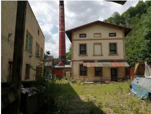
Administrativní budova - pohled z nádvoří