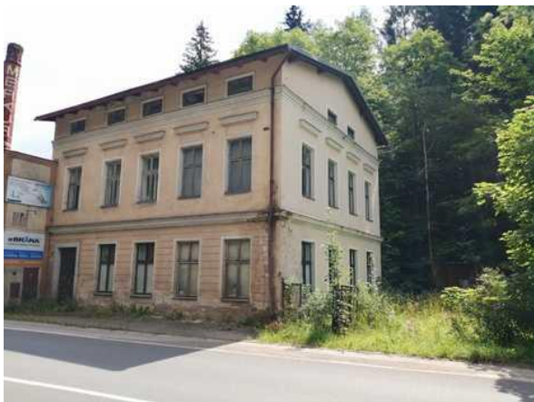
Obytná budova - pohled z ulice Nádražní