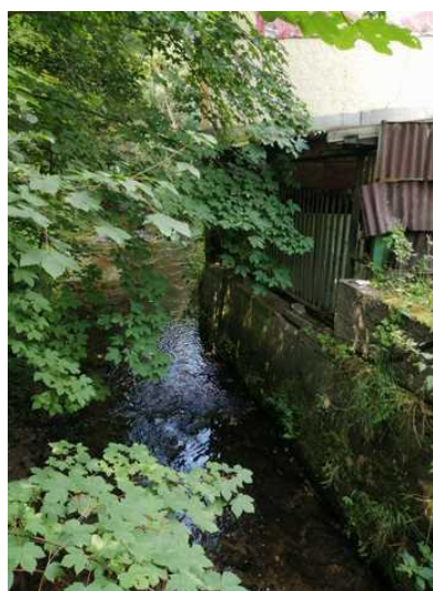
Potok Ledhujka teče podél jihovýchodní hranici areálu