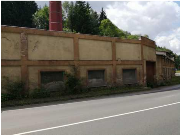
Výrobní haly - pohled z ulice Nádražní