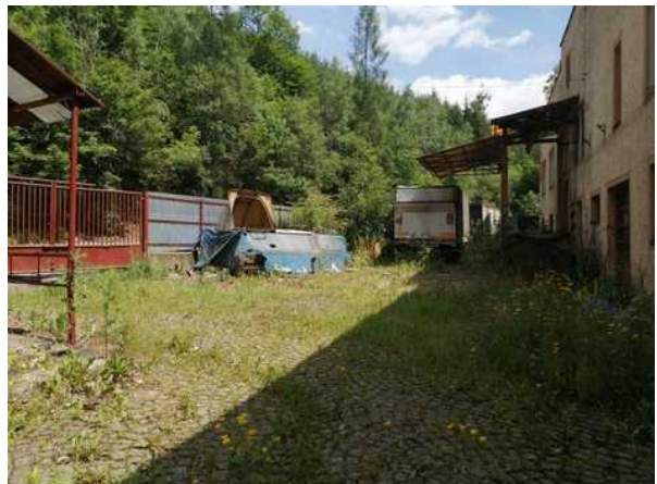
Nádvoří areálu s nákladní rampou do patra skladu