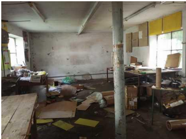
Budova skladu - montážní dílna v přízemí