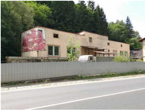
Budova skladu - pohled z ulice Nádražní