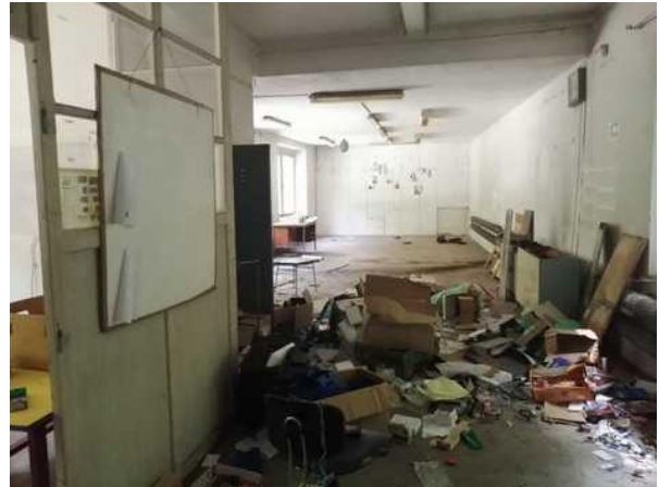
Budova skladu - montážní dílna v patře