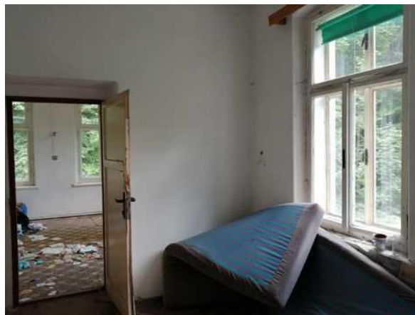
Obytná budova - pokoje bytu v patře