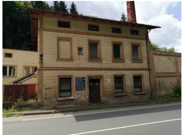
Administrativní budova - pohled u ulice Nádražní