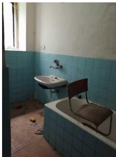
Obytná budova - koupelna v přízemí