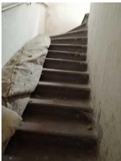
Obytná budova - točité schodiště do patra