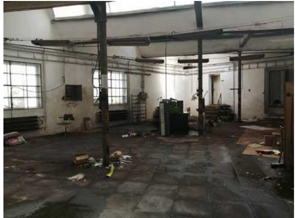
Malá výrobní hala se shedovou střechou