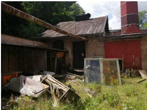
Stavba kotelny - pohled z nádvoří